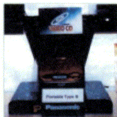
oben: Der tragbare Video-CD-Player von Panasonic kommt Mitte '95 rechts: Bereits Anfang '95 erscheint ein HiFi-Turm mit Video-CD-Player

Fußwert versehen – und schon sehen wir Klötzchen statt fein abgestufter Pixel. Liebevoller Mastering kann dieses Problem jedoch entschärfen. Auch beim Dolby-Surround-Klang kann es zu Beeinträchtigungen kommen: Manche Effekte klingen im Vergleich zur Laserdisc weniger räumlich und dynamisch.