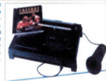
Bild oben: Das CD-i 220 (ca. 1100 Mark) ist die teuerste und edelste CD-i-Player-Version.

Cartridge erhalten sie das technische Rüstzeug. Die jeweiligen Module bergen die benötigten MPEG-Chips, auf denen die Video-CD-Technologie basiert. Wer bereits einen PC hat, kann ihn ebenfalls zum Video-CD-kompatiblen Multimedia-Computer ausbauen. So bietet u.a. die Firma Sigma eine entsprechende MPEG-Grafikkarte an („Reel Magic“). Technisch gesprochen steht „Video-CD“ für den „White Book“-Standard, auf den sich die wichtigen Elektronik-Konzerne geeinigt haben – bei der Audio-CD („Red Book“) hat sich diese Form von Übereinkunft bestens bewährt. Die Video-CD ist einseitig bespielt und spei-